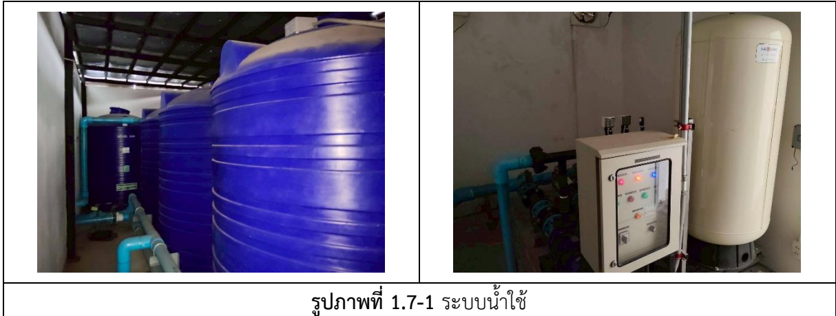
รูปภาพที่ 1.7-1 ระบบน้ำใช้

พื้นที่โครงการอยู่ในเขตบริการของการประปานครหลวง สาขาพญาไท โครงการรับน้ำประปาจากการประปานครหลวง โดยมีจุดต่อเชื่อมท่อประปาใกล้กับทางเข้า-ออกด้านหน้าโครงการ น้ำประปาจะผ่านมิเตอร์น้ำ ดังรูปที่ 1.7-1 ของการประปานครหลวงเข้าสู่อาคารโครงการ โดยแต่ละอาคารมีถังสำรองน้ำ และระบบท่อส่งน้ำประปา