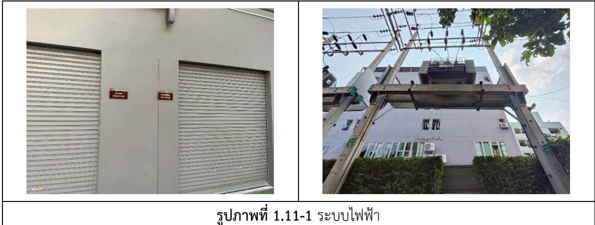
รูปภาพที่ 1.11-1 ระบบไฟฟ้า

สำหรับระบบป้องกันฟ้าผ่า และสายดิน โครงการติดตั้งระบบป้องกันฟ้าผ่าแบบดั้งเดิม (Convention System) ประกอบด้วย หลักล่อฟ้า สายล่อฟ้า สายตัวนำ สายตัวนำลงดิน และหลักสายดิน ที่เชื่อมโยงกันเป็นระบบ