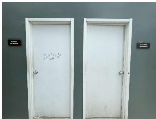
รูปภาพที่ 1.10-2 ห้องพักมูลฝอยรวม