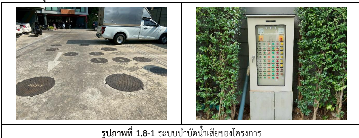
รูปภาพที่ 1.8-1 ระบบบำบัดน้ำเสียของโครงการ

โครงการจะติดตั้งระบบบำบัดน้ำเสียแยกแต่ละอาคาร โดยน้ำเสียที่เกิดขึ้นภายในอาคารจะถูกรวบรวมไปยังระบบบำบัดน้ำเสียของอาคาร ดังรูปที่ 1.8-1 ซึ่งเป็นระบบบำบัดน้ำเสียชนิดเติมอากาศแบบตะกอนเร่ง (Activated Sludge -Extended Aeration) ประกอบด้วยถังตกไขมัน ถังแยกตะกอน ถังปรับสภาพน้ำเสีย ถังเติมอากาศ ถังตกตะกอน ถังพักตะกอน ถังเก็บน้ำผ่านการบำบัด เพื่อบำบัดให้น้ำเสียเป็นไปตามเกณฑ์มาตรฐานก่อนระบายลงสู่ท่อสาธารณะ บริเวณด้านหน้าโครงการต่อไป