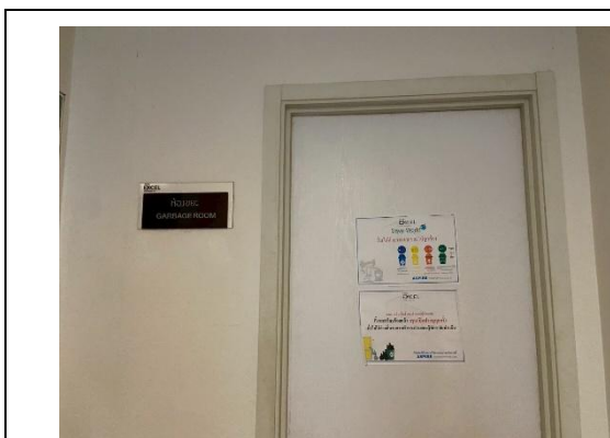
รูปภาพที่ 1.10-1 ห้องพักมูลฝอยประจำชั้น

2) ห้องพักมูลฝอยรวม โครงการจัดให้มีห้องพักมูลฝอยรวมบริเวณชั้น 1 ของอาคาร B ดังรูปที่ 1.10-2 โดยห้องพักมูลฝอยแต่ละห้องจะมีประตูปิดมิดชิด จะเปิดเฉพาะเวลาที่สำนักงานเขตห้วยขวางมาจัดเก็บ ซึ่งห้องพักมูลฝอยแต่ละห้องจะมีตะแกรงกันแมลง พร้อมติดตั้งระบบระบายอากาศ และดูดกลิ่นรวมทั้งที่ห้องพักมูลฝอยเปียกจะมีระบบดูดอากาศเสีย และจัดให้มีพนักงานคอยดูแลทำความสะอาด ภายหลังจากสำนักงานเขตห้วยขวางมาเก็บขนมูลฝอยไปแล้วในทุกๆ วัน ดังนั้นจึงไม่ก่อให้เกิดมูลฝอยตกค้างจนก่อให้เกิดผลกระทบด้านกลิ่นและทัศนภาพไม่ดีแก่ผู้อยู่ภายในโครงการและพื้นที่โดยรอบ